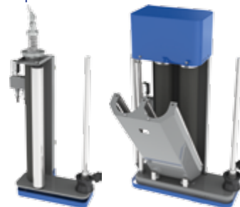
Standaard 250% voorrek